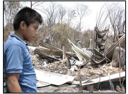
TANKANHUITZ, SLP. ¿Por qué pasó esto?

Sus donaciones en especie pueden ser entregadas a partir del próximo lunes en la calle Godard Núm. 20, Colonia Guadalupe Victoria, a una calle del metro la Raza, Tel/fax: + (52) (55) 53564724 y 53560599.