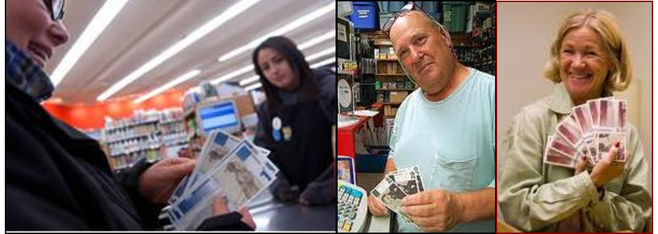
ATLANTA, Estados Unidos, jun (IPS/IFEJ) - Como respuesta a un sistema económico que consideran basado en el daño ambiental y en el lucro, varias comunidades de Estados Unidos y del resto del mundo comienzan a experimentar con formas alternativas de moneda local, con la mira puesta en la sostenibilidad.

REFUERZAN EL COMERCIO LOCAL ANTE LA GLOBALIZACIÓN EN MASSACHUSETTS, EU