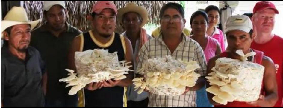
Productores mexicanos en Tezonapa, Veracruz

Ver: http://www.youtube.com/watch?v=cX0RpAH6-zE&feature=related