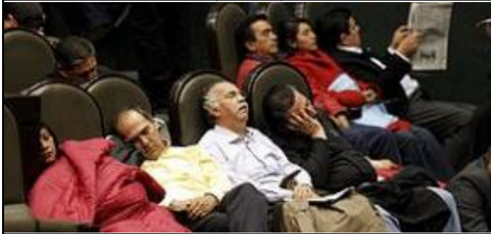
Cámara de diputados, "trabajando"

PUBLICAN CARTA AL PRESIDENTE DE LA REPÚBLICA (Resumen)