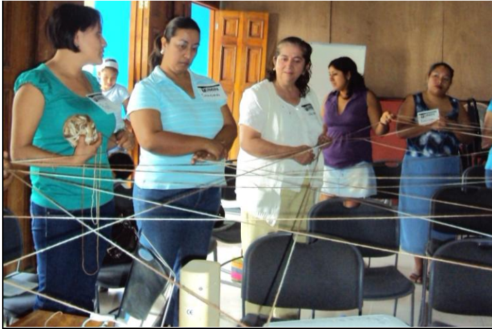
Se formó la telaraña del Túmin

Ante los medios de comunicación se ha podido explicar que este proyecto es de la sociedad civil, donde participan algunos docentes, estudiantes y egresados de la Universidad Veracruzana Intercultural (UVI), aunque no es un proyecto de esta institución. Se han coordinado para impulsar este proyecto, asociaciones civiles como el Centro de Investigación Intercultural para el Desarrollo (CIIDES), la Organización de Campesinos Sustentables (ORCAS) y la Red Unidos por los Derechos Humanos (RUDH).