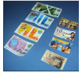
Scec y Túmin

“Estos proyectos pueden cambiar las realidades en el mundo, desde abajo y de forma pacífica cuando los políticos son incapaces de resolver los problemas. Así, la escasez de dinero y las deudas impagables, se resuelve o se reduce al decidirnos a resolver las cosas de forma comunitaria, por nosotros mismos.