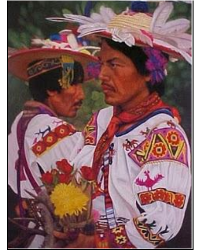
Huicholes, en San Luis Potosí

La ley minera, a pesar de ser una ley entreguista, deja explícito en su artículo 10 que las concesiones sólo podrán ser para personas físicas o morales de nacionalidad mexicana. ★