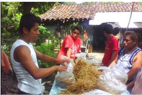
Producción en el Tototzacapan: colocando la paja (sustrato) en las bolsas

Los hongos destruyen, descomponen restos vegetales y animales y de ellos obtienen nue-