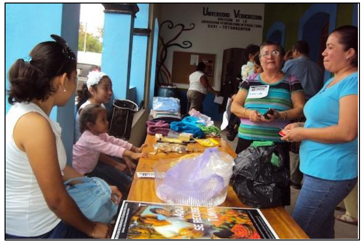
Se vendieron pasteles, ropa, discos, carteles, artesanías, jabones, etc.

De esta manera, el nuevo directorio que se entregó a los socios deberá incrementar su contenido de 84 a 95 participantes, aunque algunos aceptaron participar pero no han recibido su dinero alternativo.