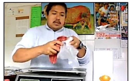
Carnicería La Orgánica: “Es un vale de descuento”

Restaurant La Casona: “Recuperamos el trueque”