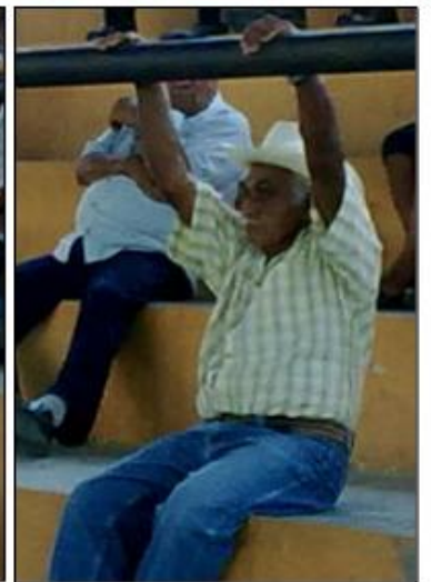
Taak'in, significa dinero en lengua maya