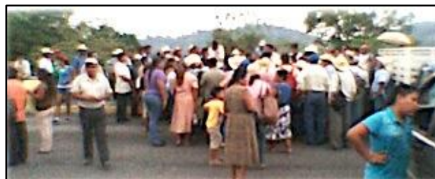
Protestan por los vehículos pesados y las detonaciones