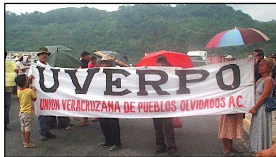
Protestan contra las afectaciones de las compañías petroleras

Al no llegar a un acuerdo, los manifestantes se movilizaron al Tajín y entonces se llegó a la resolución de una asamblea para planear las estrategias de cómo se resolverían las demandas. ★