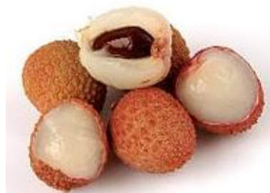
Litchi, también llamado ciruela china, es fácil de pelar.

http://propiedadesfrutas.jaimaalkauzar.es/el-litchi-el-analgésico-natural-que-eligen-los-médicos-chinos.html