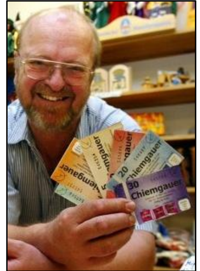
Esta moneda local se "oxida" cada 3 meses, es decir, pierde un poco de su valor. Los usuarios deben comprar y pegarle un timbre para seguir usándolo; así se estimula su circulación y se evita que nadie lo acumule.*

Desde su puesta en marcha, Chiemgauer ha estado incrementando exitosamente sus usuarios y ventas comerciales. Actualmente 700 consumidores y 380 empresas participan en este sistema con la venta de 720,000 Chiemgauer. Se espera todavía más crecimiento al introducirse la tarjeta inteligente y esta experimentación llama cada vez más atención de toda Alemania y del exterior. ★