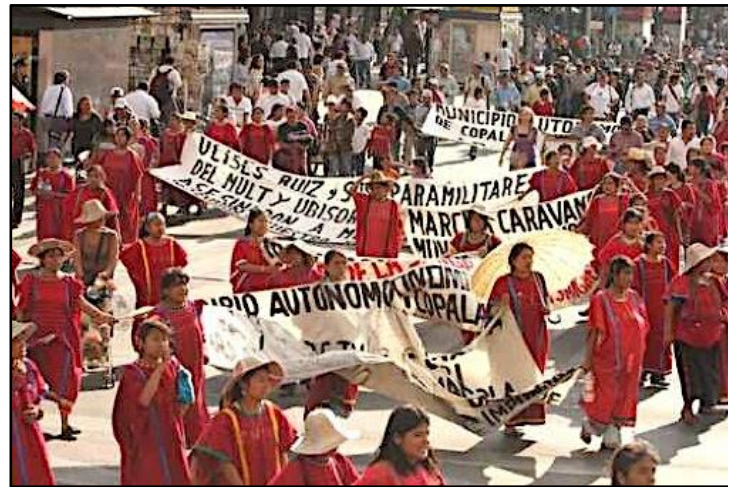
Denunciaron a los paramilitares del MULT y UBISORT, nacidos en el PRI y protegidos por los gobiernos estatal (PRD) y federal (PAN).

Al día siguiente, en un plantón, los compas de Copala denunciaron los malos gobiernos como el de Oaxaca y el de Marcelo Ebrard. Después, en la tarde se realizó una marcha con muchas mantas. Mucha gente regaló ropa y juguetes a los niños y en la noche se puso un video documental donde los compas del movimiento contra la Gran Vía exponían lo que han estado sufriendo