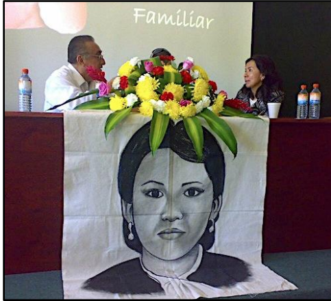
También acudieron a la CIDH, y nada

IX Aniversario del Centro de DH Digna Ochoa, en Misantla, Ver.