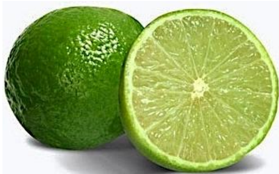
El limón, tan abundante en Papatla, es uno de los alimentos más alcalinos y curativos.