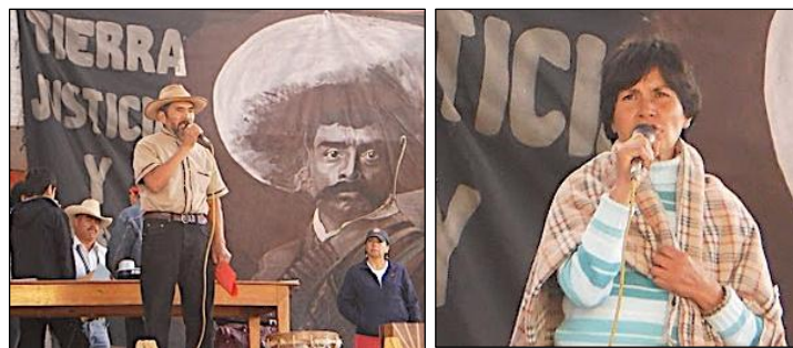
Se armó una agenda de actividades para el 2012

El 22 de Octubre el Frente de Pueblos en Defensa de la Tierra (FDPDT), de San Salvador Atenco, cumplió 10 años de lucha, presionados para que vendan sus tierras a supuestos proyectos ecológicos. Acudieron campesinos de Amomolulco; y del Municipio Autónomo de San Juan Copala; Obreros del SME; compañeros de la Otra Campaña de Azcapotzalco; mineros de Taxco, Guerrero; compas de la Otra Chilanga; estudiantes de la UNAM; Alianza Única del Valle; compas de Euskadi; el Frente Indígena Emiliano Zapata, entre otros. El FDPDT se comprometió a seguir acompañando las luchas y llamaron a que todos hicieran lo mismo. Hubo música, bailes, y en la noche una marcha de antorchas que iluminó las calles. ★