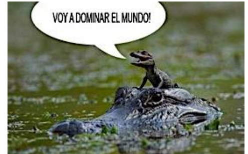
Se pasan, de veras

PROMESAS DE HERMAN CAIN, PRECANDIDATO DE EU