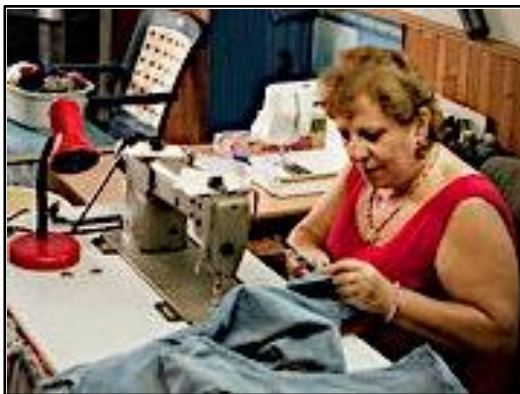
"Entusiasmo la sensación de contribuir"

Pueden pedir prestados hasta 300 TEM, por un período predeterminado. Los miembros también reciben chequeras de vales TEM, impresos con un sello especial que dificulta su falsificación. Varios comerciantes