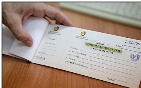
Chequera: Un Tem equivale a un Euro

de Volos, entre ellos un veterinario, una óptica y una modista, aceptan la moneda por un descuento del precio en euros. Hay ofertas de clases de guitarra y de inglés, servicios de contaduría, soporte técnico de computadoras, descuentos en peluquerías y en el uso de jardines para organizar fiestas. Y un sistema de calificaciones para que la gente pueda describir sus experiencias y mantener un control de calidad transparente.