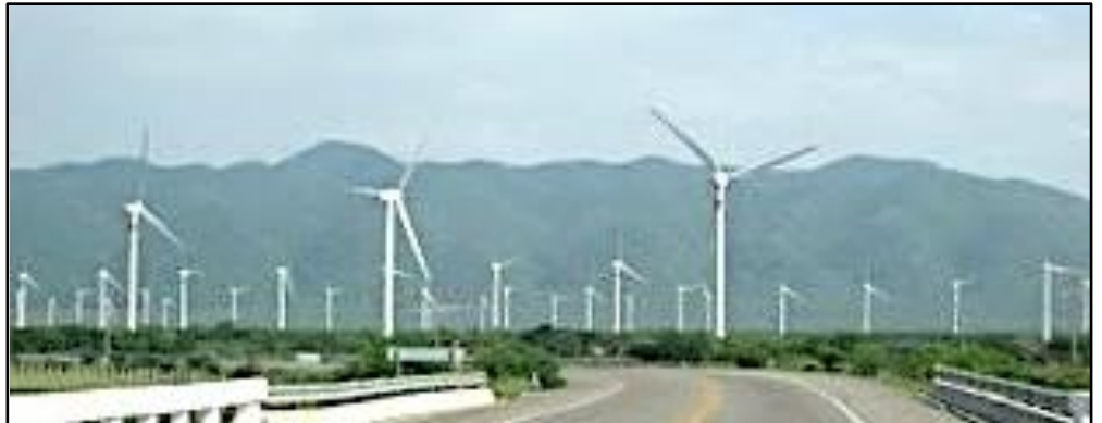
ISTMO DE TEHUANTEPEC. Generación de energía por empresas españolas, para Grupo Bimbo, gran productor de comida chatarra en el país.

Destacó que tierras de alta productividad, como mil 50 hectáreas de riego del ejido La Venta, producían al año