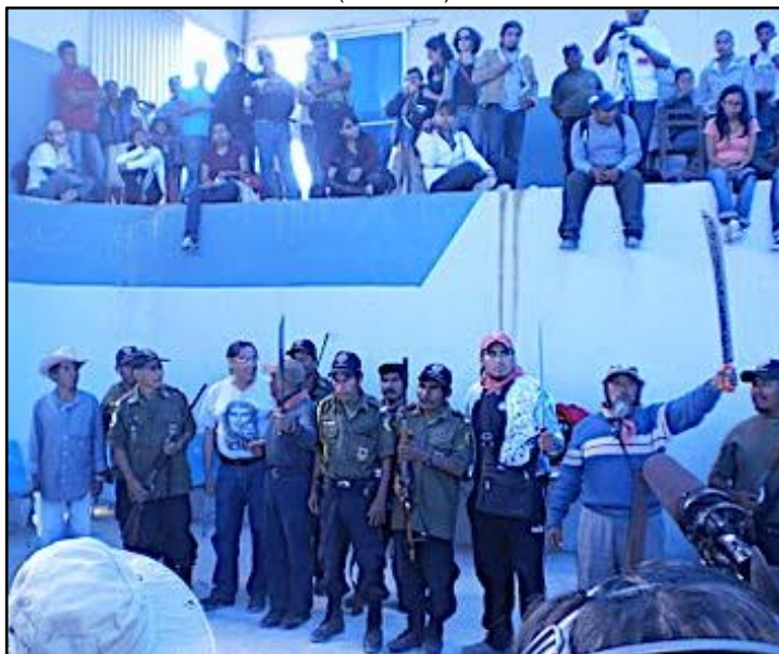
La Policía Comunitaria, TADECO y Atenco

SECTOR OBRERO Y DE TRABAJADORES DE LA OTRA CAMPAÑA (Resumen)