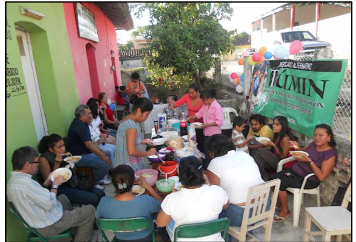
El Túmin, una suma de pequeños esfuerzos y voluntades.

El miércoles 26 de octubre fueron llegando alrededor de 40 compañeros y amigos del Mercado Alternativo a la Casa del Túmin, para celebrar un año de este proyecto de Economía Solidaria y Autogestión. Ahí compartimos alimentos y festejamos nuestros logros, llegando a ser más de 100 socios.