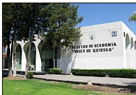
Universidad Michoacana de San Nicolás de Hidalgo

En seguida se explicó que las monedas comunitarias tienen fines y modos contrarios al sistema capitalista en lo económico, lo político e ideológico, ya que no sólo buscan recuperar la función social del dinero en el intercambio de la riqueza, sino también nuevas formas de organización comunitaria y una educación basada en la solidaridad y el apoyo mutuo. En este contexto se explicó que el Túmin en el Totonacapan funciona como un instrumento de intercambio entre más de cien productos de diversos bienes y servicios.