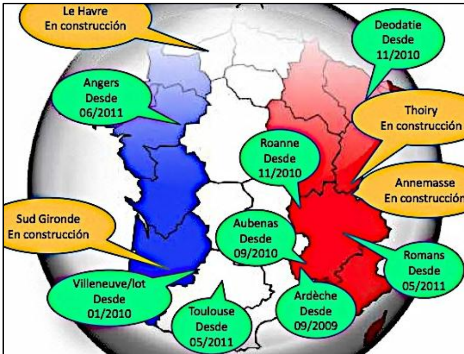
PROYECTO TAOA 3

A fin de dinamizar el desarrollo local, reforzar el vínculo social y alcanzar un consumo sostenible con equilibrio ecológico, existen al menos 12 monedas locales en diversas comunidades de Francia.